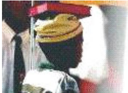
Sending in Soshanguve

Sedert 2005 het die Sendingskommissie van Pretoria Maranata begin met 'n proses wat die strategiese doelwitte vir die sendingswerk vir die volgende 5 jaar uitklaar. Die proses is verdeel in 3 fases, waartydens verskillende rolspelers bymekaar gekom het om: