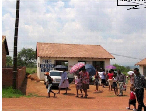
Soshanguve Suidoos na die erediens

Die visitasiespan het veral gefokus op die werkslas van sendelinge en studente binne die sendingsgemeentes. Die wye verskeidenheid van take wat ook aan die sendingswerkers opgedra word, is ondersoek en moontlike areas van samewerking tussen die verskillende sendingsgemeentes in Suid-Afrika geïdentifiseer. Daar is dus ook met 'n aantal