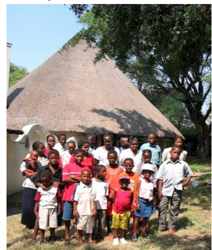
Die gemeente van Soshanguve Suid

ook opgemerk dat die samewerkingsmodel van groot waarde kan wees binne enige sendingsgemeente—weereens 'n gawe waarvoor God elke dag gedank moet word.